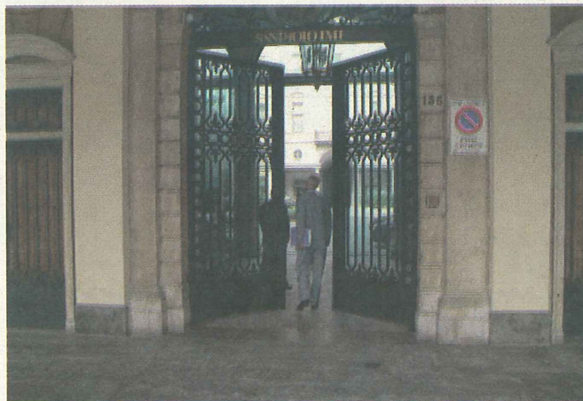
L'ingresso della sede torinese dell'istituto bancario

Intesa Sanpaolo offre alle imprese un finanziamento destinato a coprire il deflusso del trattamento di fine rapporto in seguito alle norme introdotte dalla Finanziaria 2007. Si tratta di un'opportunità pensata per le aziende dei diversi settori merceologici, che avranno un flusso di cassa in uscita per l'adesione dei propri dipendenti a forme di previdenza complementare o, in alternativa, per il trasferimento in gestione all'Inps del Tfr che i lavoratori dichiareranno di non voler conferire a forme di previdenza complementare. Lo strumento messo a punto da Intesa Sanpaolo consente di compensare per intero la perdita dei flussi di tfr, che fino a oggi rappresentavano per l'impresa una primaria fonte di autofinanziamento, coprendo da subito le uscite stimate per i prossimi tre anni, compreso quello in corso. L'erogazione, infatti, avviene sulla base di una stima triennale